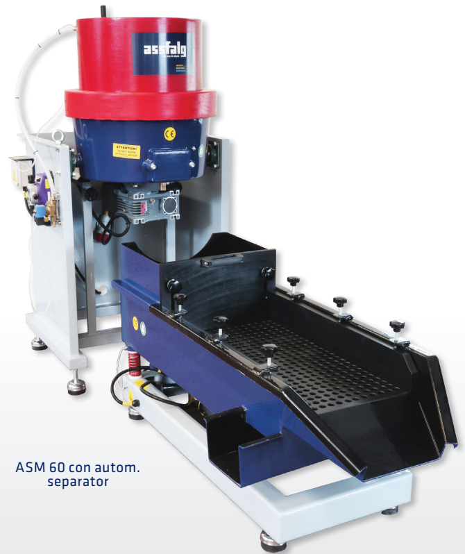
ASM 60 con autom. separator

Las instalaciones de centrifugado ASM son idóneas para piezas pequeñas. Con una mayor intensidad de procesamiento desbarban 10-20 veces más rápido que las pulidoras de vibración. La instalación de centrifugado se puede diseñar desde equipo individual hasta planta automática.