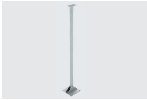
> Columna inox para indicador