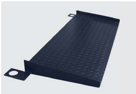
> Rampa hierro