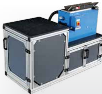
KSM 125 con tren inferior y aspiración integrada