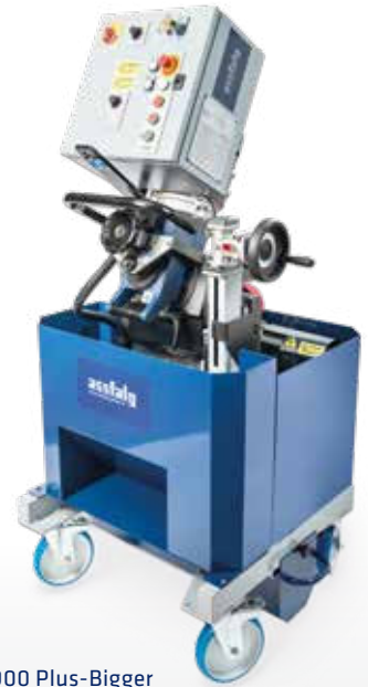
ASO 900 Plus-Bigger